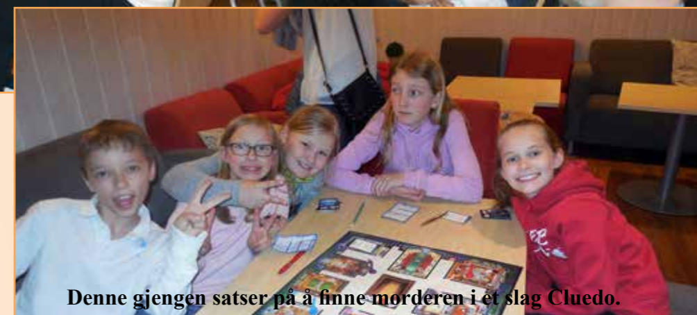
Denne gjengen satser på å finne morderen i et slag Cluedo.