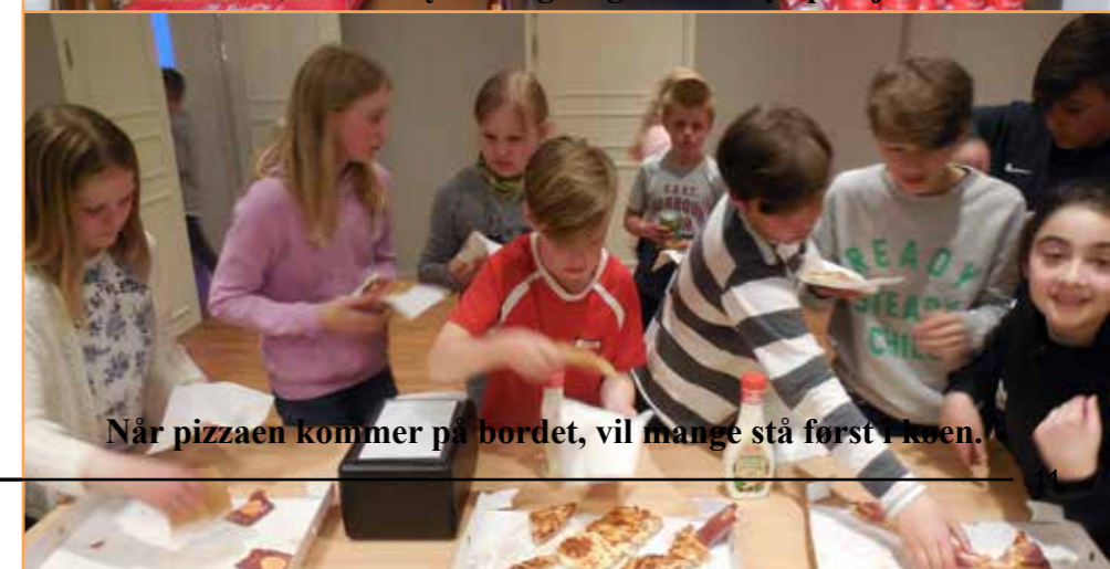
Når pizzaen kommer på bordet, vil mange stå først i køen.