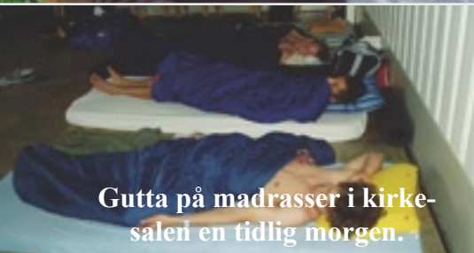
Gutta på madrasser i kirkesalen en tidlig morgen.