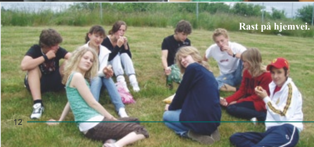
Rast på hjemvei.

Det er tradisjon at tenåringerne i Frikirkemenighetene i Fredrikstad og Sarpsborg reiser sammen til Göteborg en helg rett før sommerferien. Det er plass til 40 stykker i bussen og i Sjømannskirken for overnatting, så det er de 20 første påmeldte fra hver by som får være med. 15. – 17. juni gikk årets tur av stabelen.